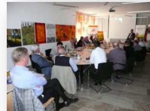
Regionaltage in Dürmentingen, Mai'10, und Crailsheim, Juni'10