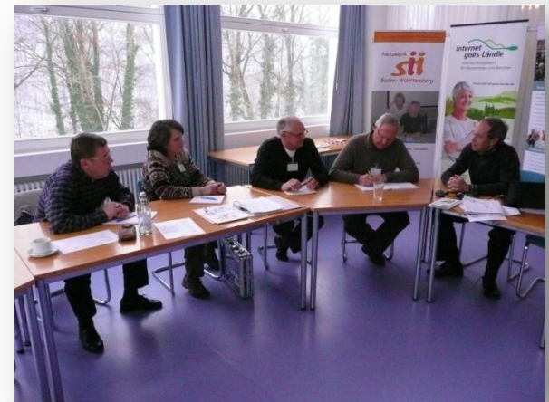
Seminar in Bad Urach, Februar 2010