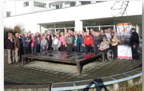
Seminar in Bad Urach, November 2009

2-stufiges Qualifizierungskonzept (Grundqualifizierung + Erstellung des weiteren Konzepts sowie Erprobung gemeinsam mit SIH-Trainer/-innen)