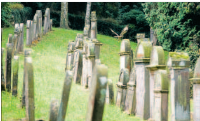
Ein verstecktes Juwel in Remseck-Hochberg, der Jüdische Friedhof

Durch den Jüdischen Friedhof in Remseck-Hochberg führt Sie Pfarrer Jochen Maurer. Männliche Besucher werden gebeten, eine Kopfbedeckung mitzubringen. Anschließend Möglichkeit eines Besuchs des "Jüdischen Zimmers" im Museum Altes Schulhaus und eines Besuchs des Remser Heimatvereins.